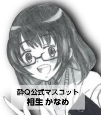
酔Q公式マスコット 相生 かなめ

2022年に流行した「キンプリ構文」を元にしたクイズ。「待ってこれ... ○○隠れてるんだけど...」という形でテーマと文章を出題。1行につき1文字ずつ拾って「テーマに沿った単語」を解答してください(つまり4行の文章なら4文字の単語になる)。各問題とも答えが5つ隠れています(別の答えと同じ文字を共有する場合があります)。正解で+1pt.、誤答は-1pt.、エンドレスチャンス方式の早押しクイズ(解答は1人1つ)。答えが5つすべて出たらその問題は終了。最終ポイントが最も多い人が優勝。(作・ポン太)